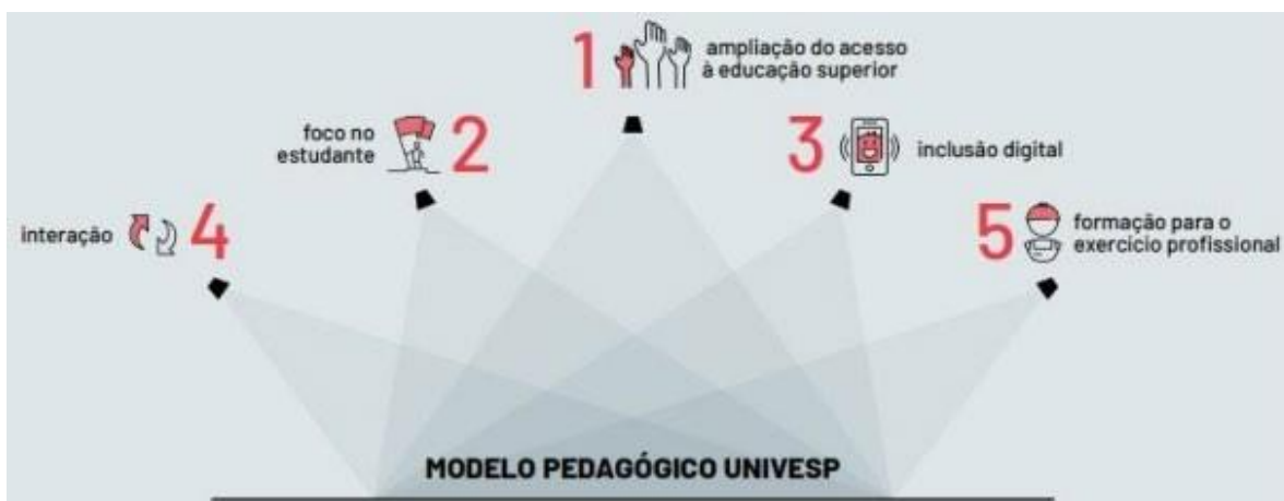
Figura 1 - Modelo Pedagógico UNIVESP

5) Formação para o exercício profissional: a formação proposta pela universidade proporciona uma sólida formação que garanta ao futuro profissional as condições necessárias para a superação dos desafios apresentados no mercado de trabalho.