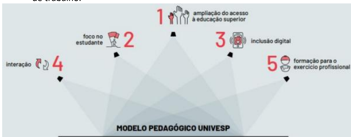
Figura 1 - Modelo Pedagógico UNIVESP

Para melhor cumprir as diretrizes do modelo pedagógico, os cursos da UNIVESP estão sendo organizados em Eixos de Formação. Cada eixo permite tanto a facilidade de ingresso e distribuição de vagas quanto a opção de escolha para os alunos. Foi com base